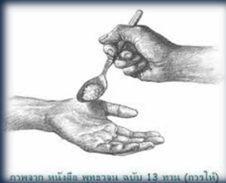
ภาพจาก หนังสือ พุทธวจน ฉบับ 13 ทาน (การให้)

(ถอดความ) การมีความเมตตากรุณาและให้ความช่วยเหลือแก่ผู้ที่ประสบภัย ทำให้เขารอดพ้นจากความทุกข์ยาก ผลที่ได้รับคือผู้คนจะพากันสรรเสริญทั้งในปัจจุบันและอนาคต